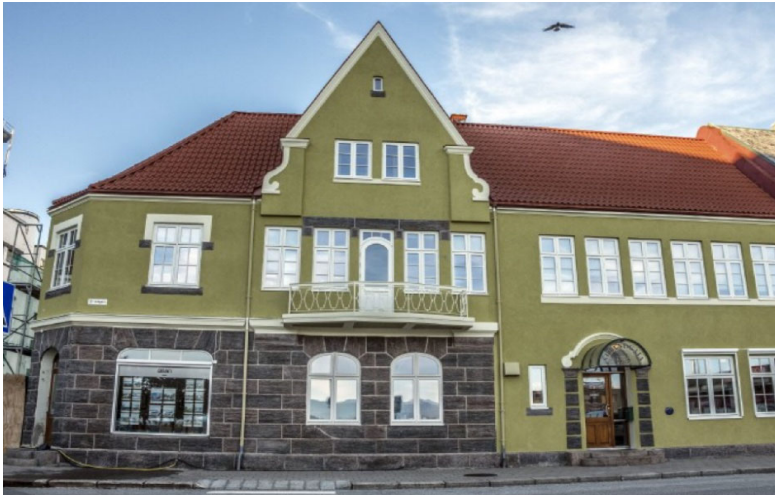
Rehabilitert av Smørholm AS